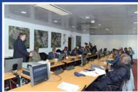
Anvers inspire les administrateurs du PAD