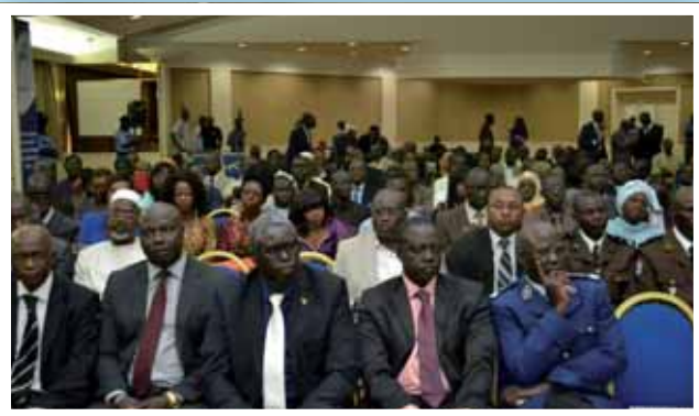
... et membres de la communauté portuaire au rendez-vous.