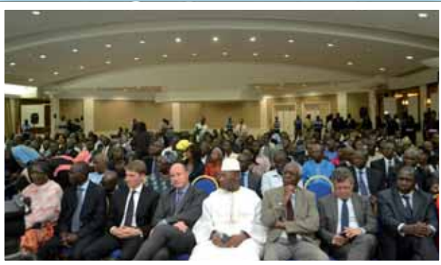
De nombreux officiels...