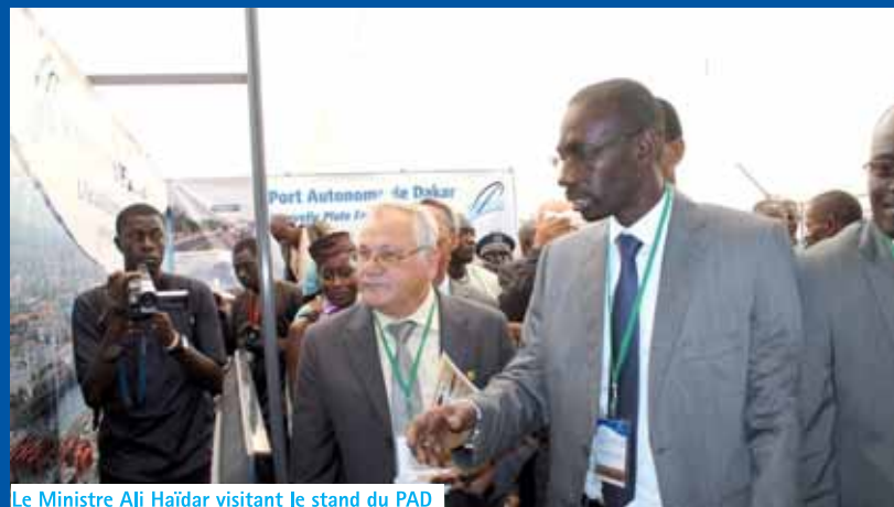
Le Ministre Ali Haïdar visitant le stand du PAD

Ainsi, durant trois jours d'atelier, experts maritimes