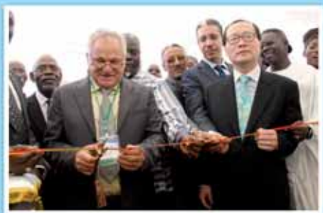
Dakar a son salon maritime