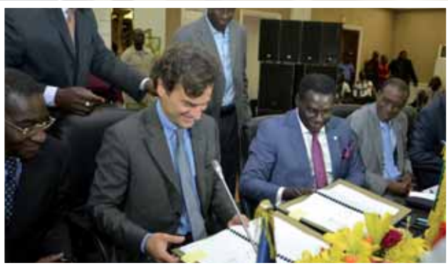
Les deux dg parafant la convention