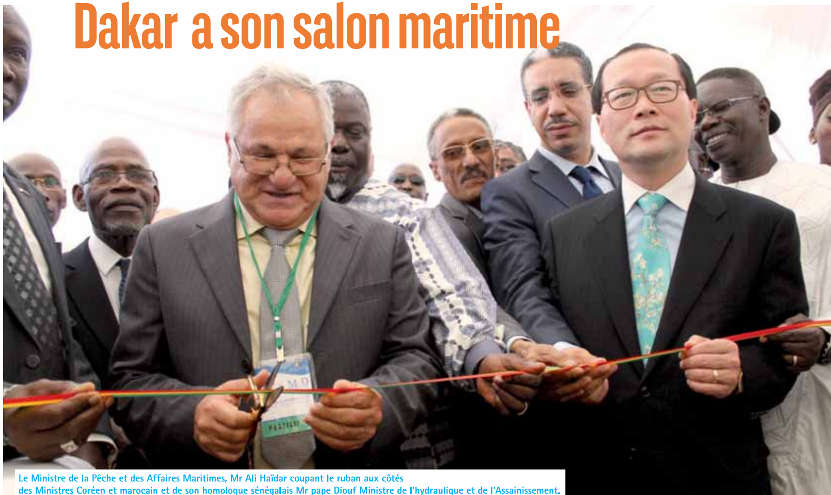
Le Ministre de la Pêche et des Affaires Maritimes, Mr Ali Haïdar coupant le ruban aux côtés des Ministres Coréen et marocain et de son homologue sénégalais Mr pape Diouf Ministre de l'hydraulique et de l'Assainissement.

Le Port Autonome de Dakar a participé au Salon Maritime de Dakar qui s'est tenu du 04 au 06 Octobre 2013 à l'Hôtel King Fahd Palace, sous l'égide du Ministère de la Pêche et des Affaires Maritimes.