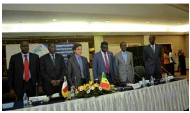
Vue sur le présidium...