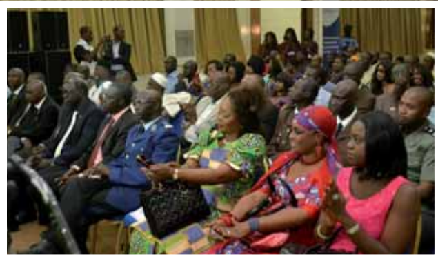
.... Et sur l'assistance.