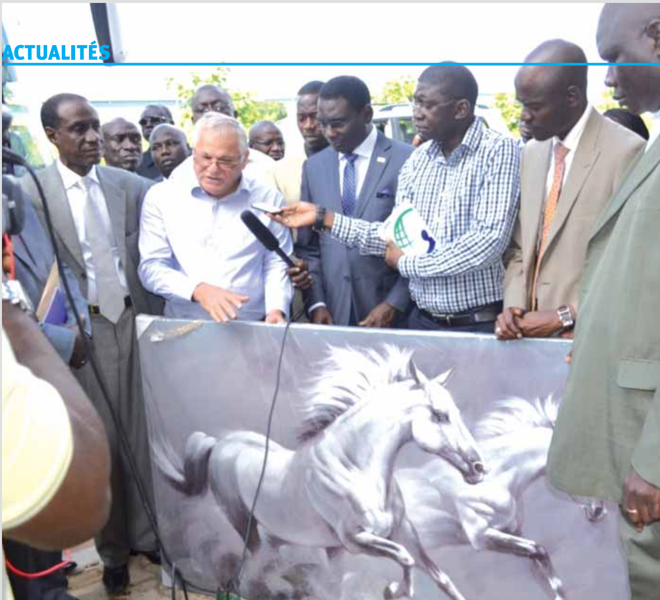
Remise de cadeau et échanges avec la presse à la Plateforme de distribution

Il y a des urgences pour le Port et Monsieur le Directeur Général l'a bien compris. Il y a un véritable problème d'insalubrité lié à la présence de vieux bateaux qui ont coulé dans le Port. Ceci n'est pas économiquement viable. Car lorsqu'un vieux bateau coule, il immobilise des espaces et pour longtemps. Il faut trouver des solutions et agir avant l'immersion de ces navires. Nous avons vu aussi que le plan d'eau est assez agressé par rapport à la pollution. Tout cela nous interpelle au plus haut point. Le développement du Port nécessitera de lourds investissements. Nous allons appuyer cela auprès du Président de la République afin d'aider le Port à réhabiliter ses